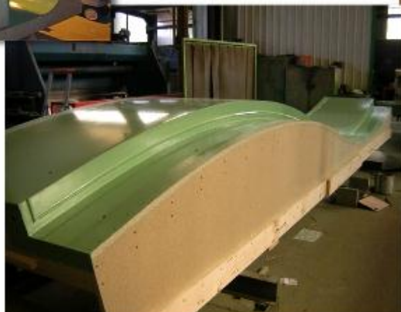
Moule pour garde corps (client : PLATTARD)

Les moules bois et métal sont des pièces uniques réalisées par notre personnel hautement qualifié.