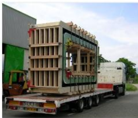
Moule pour cadre (client : PREFA 31)