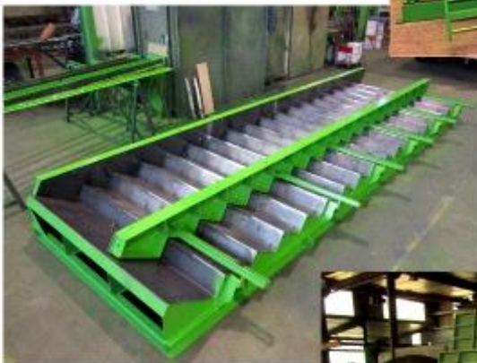
Moule pour caniveaux modulaires (client : BONNA SABLA)