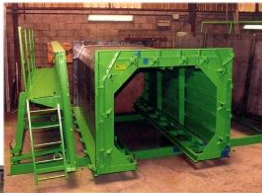
Moule pour escaliers volée droite (client : Chazey Bons PREFA)