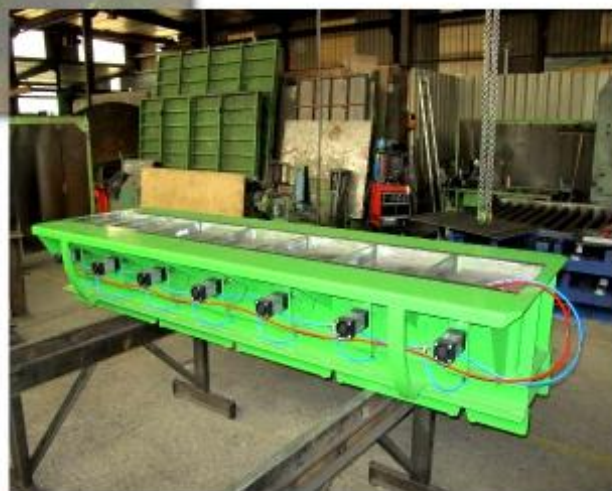
Moule pour regards sur "pondeuse" (client : PERRIN)