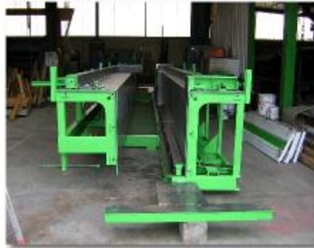
Moule pour gradins Stade Geoffroy GUICHARD (client : PBM)

Nous exportons nos produits et notre savoir-faire dans le monde entier: