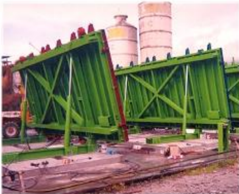
Tables hydrauliques pour façade pavillon (client : SOBEPRE- St-Benoît-de-la Réunion)