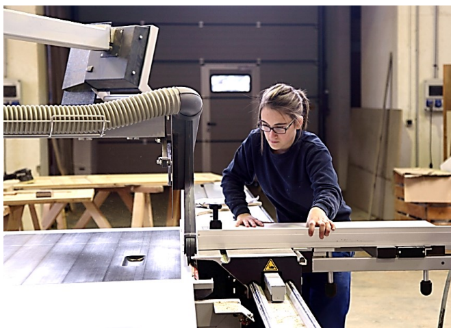
Ecole Privée d'Enseignement Technique