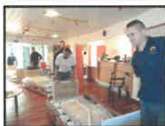
Acheminer le nouveau mobilier