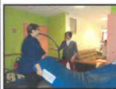
Déménager l'ancien mobilier

⇒ Livraison et installation du nouveau mobilier pour 26 chambres (jeudi 29/11/2018) :