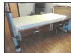
Lit, fauteuil, bureau et siège (assorti à la couleur du couloir), manque le Chevet.