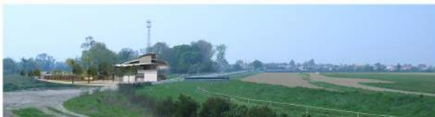
Insertion des projets dans leur environnement