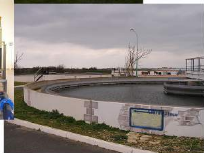
Stations de traitement de eaux potables et usées